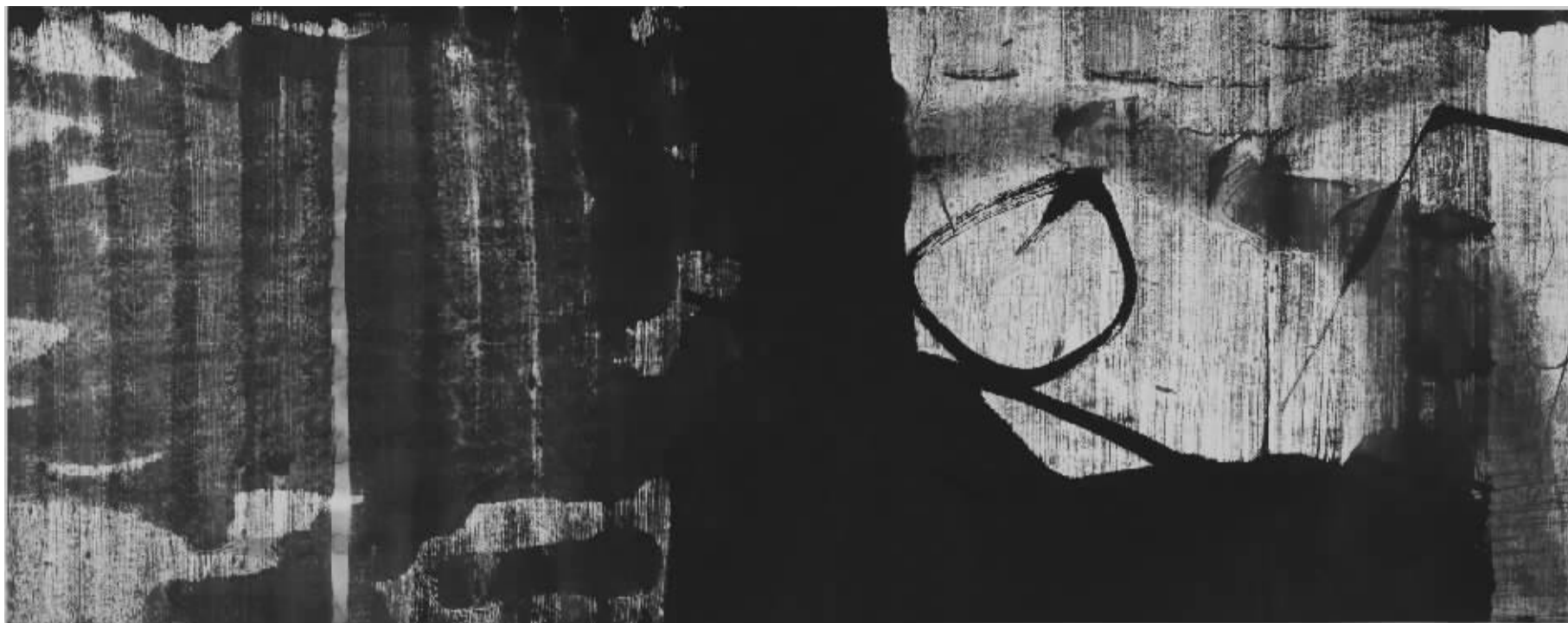
《昼》水墨 53cm × 135cm