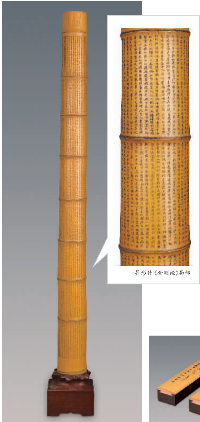
异形竹《金刚经》局部