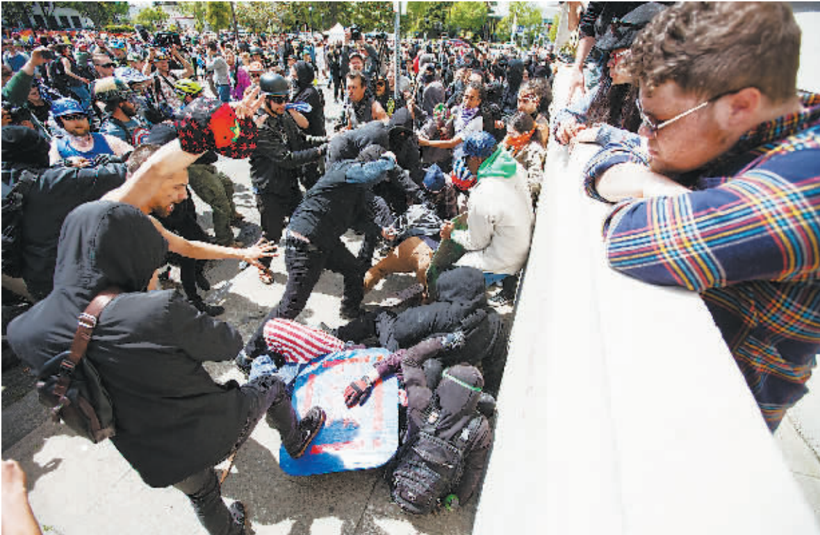
当地时间4月15日，美国加州伯克利，特朗普支持者与反对者举行集会活动，双方街头陷入打斗，引发激烈暴力冲突。