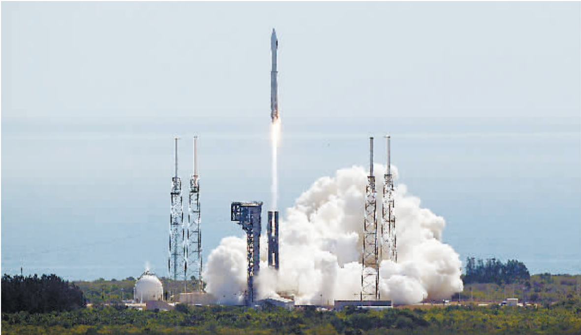
当地时间18日,“天鹅座”飞船搭乘美国联合发射联盟公司的“宇宙神5”火箭发射升空。

美国轨道ATK公司18日利用“宇宙神5”火箭发射“天鹅座”飞船,执行第七次国际空间站货运任务。美国航天局第一次提供360度全景视频直播,但发射瞬间的直播却遭遇技术问题。 美国东部时间18日11时11分,“天鹅座”飞船搭乘美国联合发射联盟公司的“宇宙神5”火箭,从佛罗里达州卡纳维拉尔角空军基地发射升空。 飞船携带约3.5吨物资,除宇航员的给养外,还有相当多的科研物资,其中一个项目用于提高化疗药物治疗癌症的效果,还有一个密封设施用于研究在太空种植作物,以支持宇航员执行长期太空任务。飞船上还携带38颗微型立方体卫星,其中多数由大学生研制,它们将于未来几个月从飞船和空间站中被释放进入太空。 此次发射美国航天局提供360度全景视频直播,这也是世界上第一次火箭发射使用360度视频直播,让观众享受身临其境的发射台发射观看体验。但直播出了一点小问题,前一秒火箭还停留在发射架上,后一秒已飞到半空中。美国航天局在一份声明中已经证实遇到技术困难。