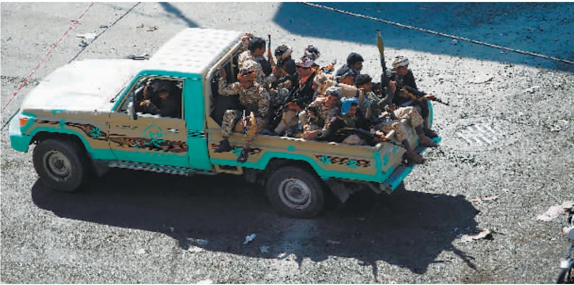
3日,在也门萨那,胡塞武装在街头巡逻。

也门胡塞武装和支持前总统萨利赫的军队3日在首都萨那使馆区发生激战。有消息称交火造成上百人死亡,伊朗驻也门大使馆遇袭起火。