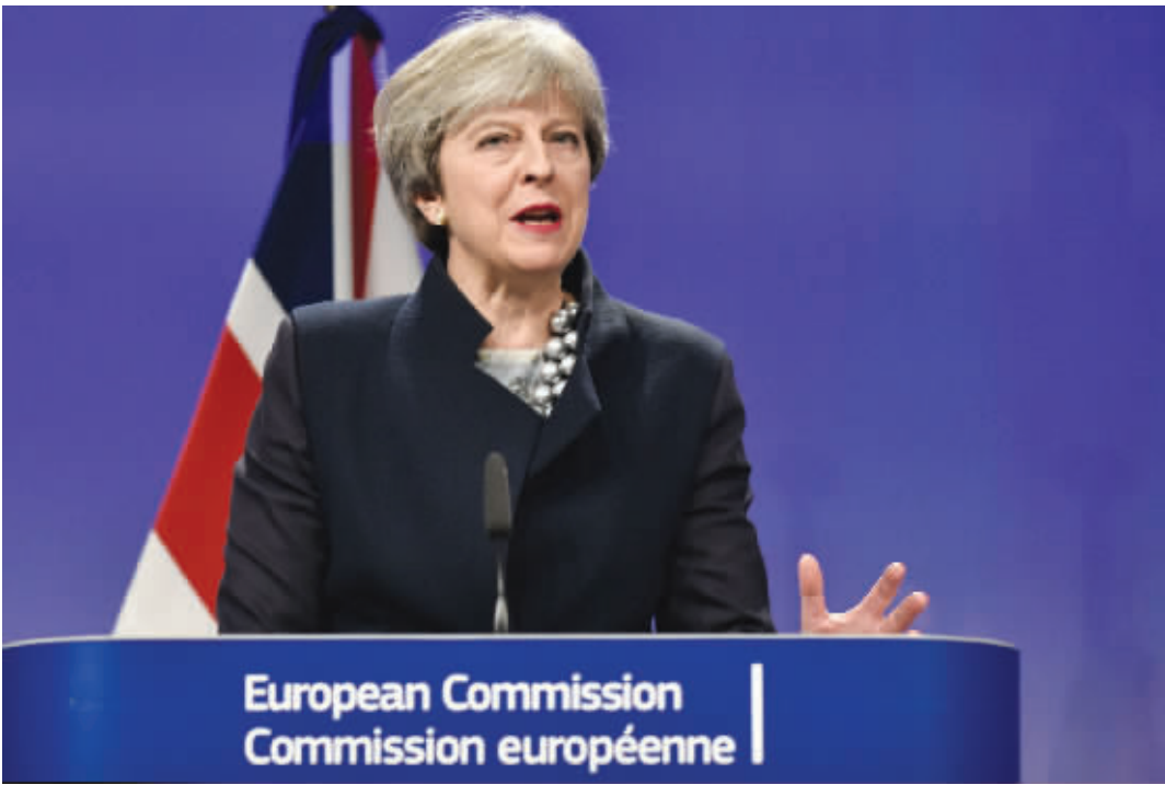
12月4日,在比利时布鲁塞尔,英国首相特雷莎·梅发表讲话。

英国首相特雷莎·梅4日与欧盟委员会主席容克举行“脱欧午餐”,就英国与爱尔兰边界“分手费”以及欧盟在英公民权利等议题举行新一轮谈判。受制于一些核心分歧,双方未能打通第一阶段谈判的“最后一公里”,将在本周晚些时候继续磋商。