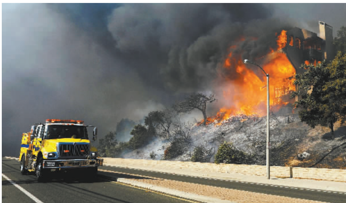
5日，在美国加利福尼亚州南部文图拉县，消防车经过一处着火建筑。

5日，在强劲风力、低湿度以及干枯植被的助力下，美国南加州多地山火肆虐，数以万计的民众被紧急撤离，数以百计的建筑物被烧毁，当地多条重要高速公路部分路段被关闭。