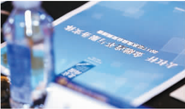
年度报告精彩呈现