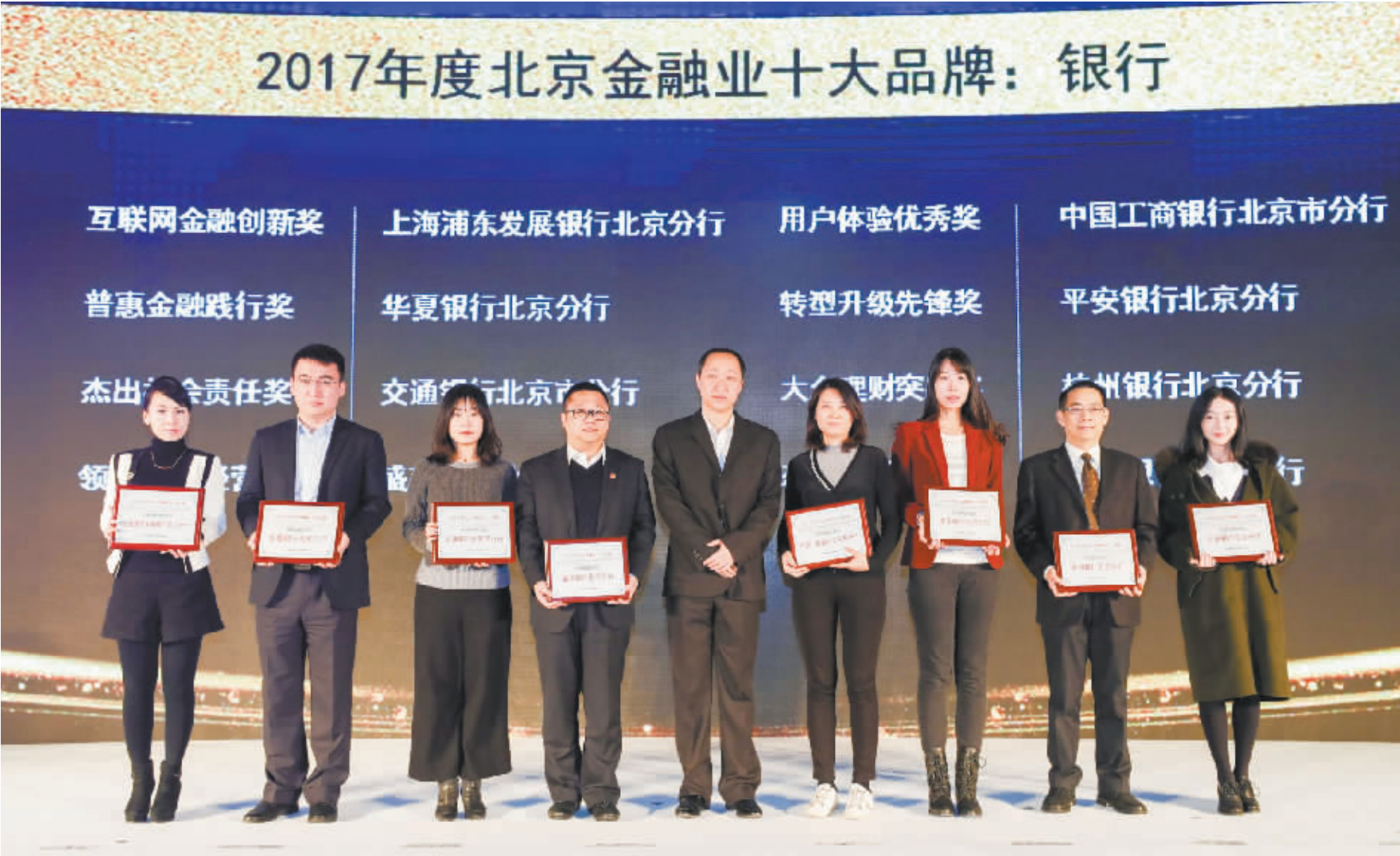
8家银行夺得单项奖