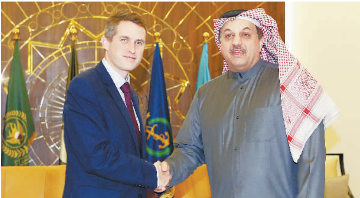
10日,在卡塔尔多哈,卡塔尔副首相兼国防事务国务大臣哈立德·阿提亚(右)会见英国国防大臣加文·威廉姆森。

卡塔尔副首相兼国防事务国务大臣哈立德·阿提亚10日在多哈会见英国国防大臣加文·威廉姆森,双方签订了总价值80亿美元的军购协议。