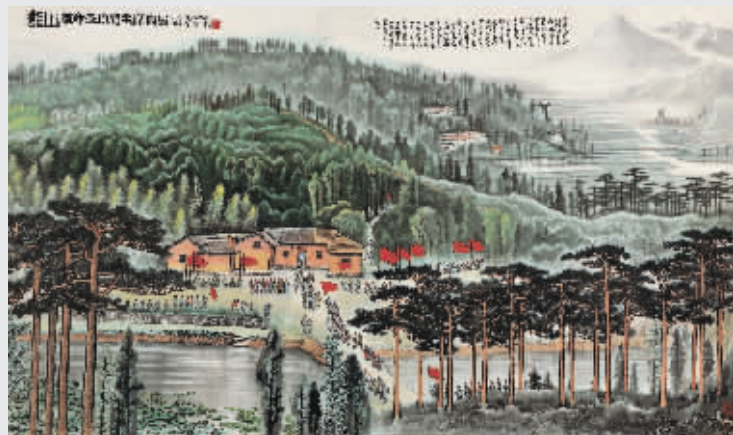
▲李可染《韶山——革命圣地毛主席旧居》 1974年作 镜心 设色纸本 141.5×243cm 估价待询