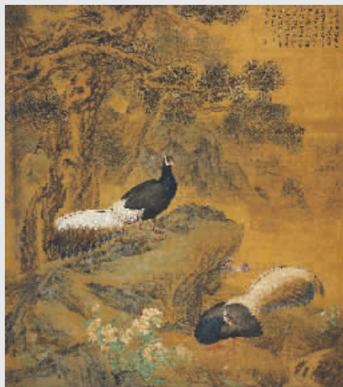
▲郎世宁、金廷标《火鸡图》 镜心 设色绢本 212×188.5 cm 估价待询

古代书画部分将推出百代标程(第四季)——从赵孟頫至郎世宁,照旧涵括6件作品,汇集了中国古代书画宗师典范之作。其中以赵孟頫《行书般若波罗蜜多心经》最为重要。