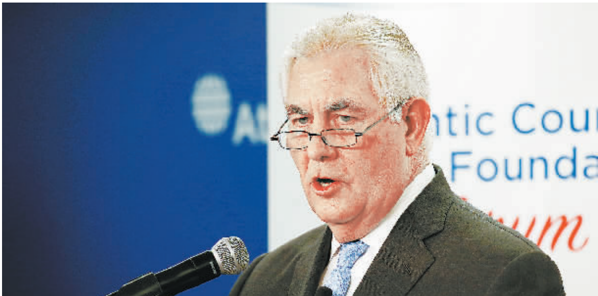
12日,在美国华盛顿,美国国务卿蒂勒森出席论坛时发表演讲。

美国国务卿蒂勒森12日表示,只要朝鲜愿意重返谈判桌,美国愿与朝鲜展开无条件对话。