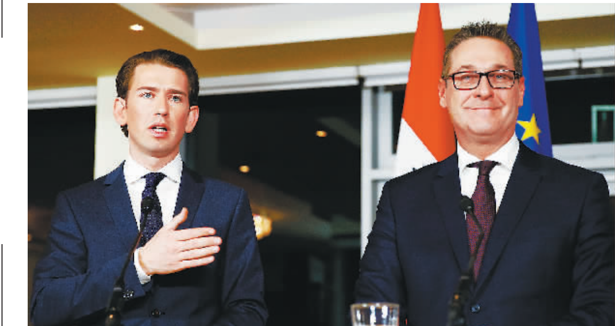
16日,在奥地利首都维也纳,即将出任奥地利总理的库尔茨(左)和奥地利自由党领导人施特拉赫出席新闻发布会。

即将出任奥地利总理的库尔茨和未来执政伙伴奥地利自由党领导人施特拉赫16日公布了施政计划。双方强调,即将上任的新政府将采取亲欧洲政策,加强社会安全,打击非法移民。