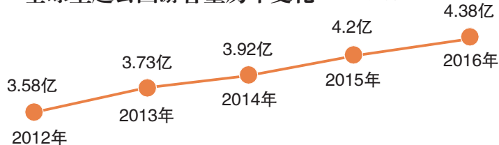
全球主题公园前25位游客量变化