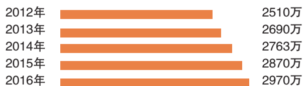
亚太地区排名前20位水上乐园游客量变化