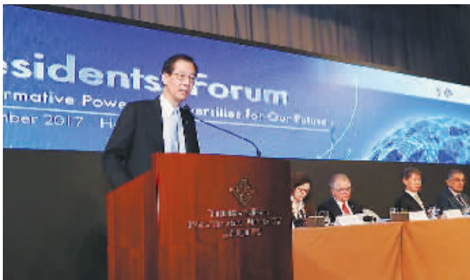
香港理大校长唐伟章致欢迎辞

香港理工大学(香港理大)日前举办“大学校长论坛”。论坛题为《大学改变未来发展的能力》,有超过100位高等院校的教育界领袖汇聚于香港理大的研究及教学酒店唯港荟,分享真知灼见。他们分别来自20个国家和地区,代表超过30家国际知名的高等学府。该论坛是香港理大庆祝建校80周年的一项重点活动。