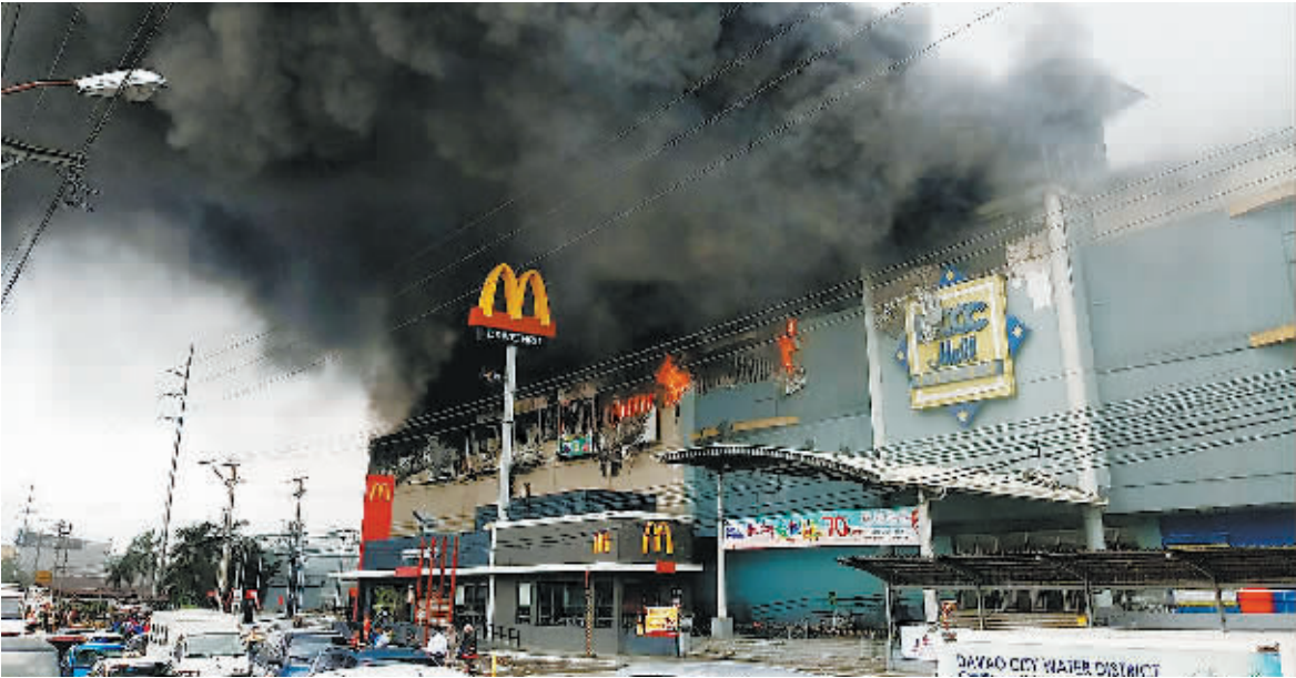
23日,菲律宾南部城市达沃的火灾现场升起浓烟。

菲律宾南部城市达沃市一商场23日发生一起火灾,大火持续到24日才被扑灭,火灾中失踪的37人恐已无生还可能。