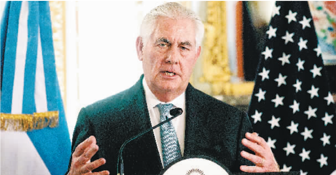
4日,美国国务卿蒂勒森抵达阿根廷进行正式访问,与阿根廷外交部长豪尔赫·福列举行联合新闻发布会。

4日,阿根廷布宜诺斯艾利斯,美国国务卿蒂勒森抵达阿根廷进行正式访问,与阿根廷外交部长豪尔赫·福列举行联合新闻发布会。