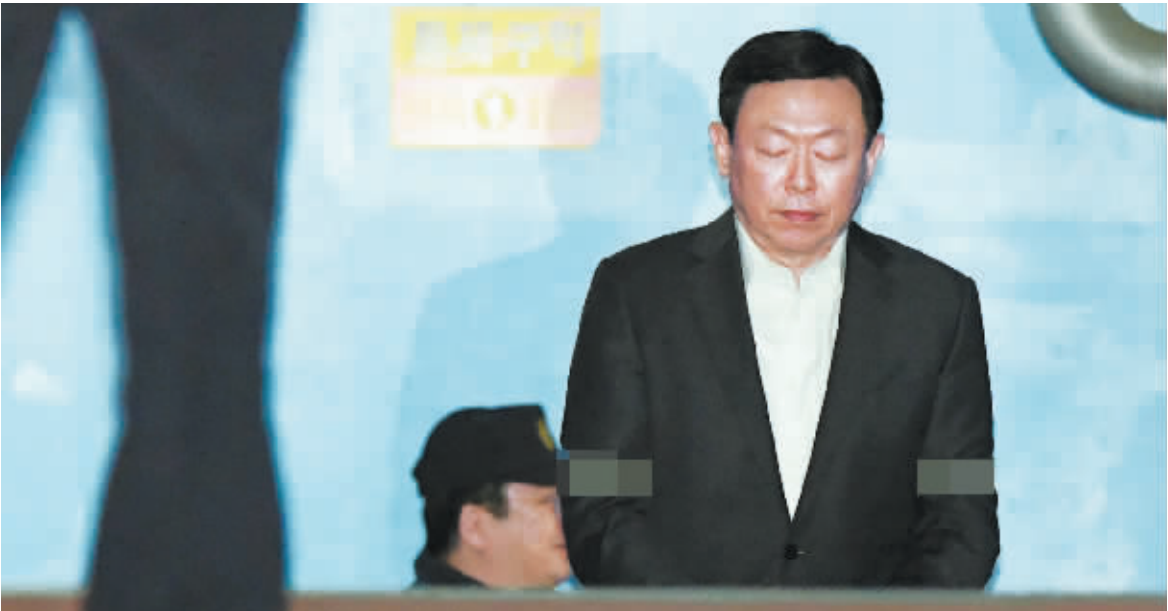
13日下午,韩国首尔中央地方法院对乐天集团董事长辛东彬“亲信干政门”相关案件做出一审宣判。

据韩联社报道,当地时间13日下午,韩国首尔中央地方法院对乐天集团董事长辛东彬“亲信干政门”相关案件做出一审宣判,因涉嫌行贿遭检方起诉的辛东彬获刑两年6个月,当场被拘捕。法院认定辛东彬行贿70亿韩元,认定朴槿惠与辛东彬关于乐天免税店存在不正当请托。