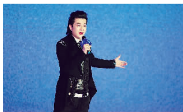
著名青年歌手林羽精彩献唱