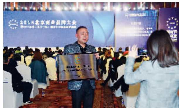
获奖企业代表拍照留念