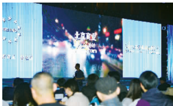
现场播放展现首都商业风貌的《北京商业24小时》纪录片