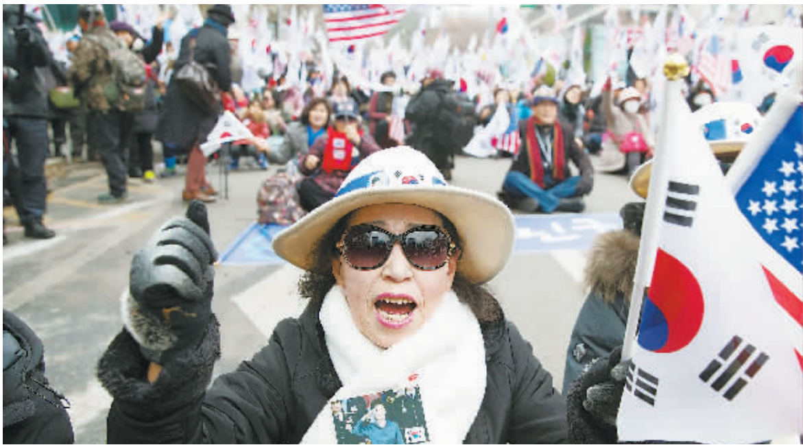
27日，韩国前总统朴槿惠的支持者在法院附近集会，要求释放朴槿惠。

当地时间27日，韩国前总统朴槿惠的支持者在法院附近集会，要求释放朴槿惠。当天韩国首尔中央地方法院刑事合议庭22部对朴槿惠“亲信干政”案进行结案公判，检方建议法院判处韩国前总统朴槿惠30年刑期。