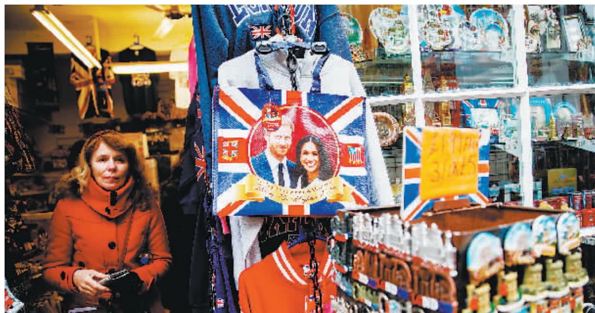
1日，英国温莎，温莎城堡附近的纪念品商店里，哈里王子与马歇尔准王妃的纪念品热销。

当地时间1日，英国温莎城堡附近的纪念品商店里人头攒动，哈里王子与马歇尔准王妃的纪念品热销。