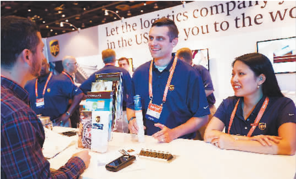
去年6月阿里巴巴举行的“美国中小企业峰会”，吸引了超过3000家美国中小企业和合作伙伴参会

经常在世界各地穿梭的马云十分了解同西方的沟通方式，更清楚美国政府和特朗普关心的是什么。马云用事实说话，指出尽管中美存在贸易逆差，但美国经济仍然向好。并且，中国有3亿中产阶层，居民收入在以接近两位数的速度增长，消费升级规模巨大，正驱动中国从全世界吸引进口商品。因此，进入这个世界最大的消费市场，这是今天摆在美国面前的巨大机会。马云就此提出美国必须考虑的问题：恰恰是在这个机遇到来之时，美国政府决定发起史无前例的贸易战，美国是要通过这种