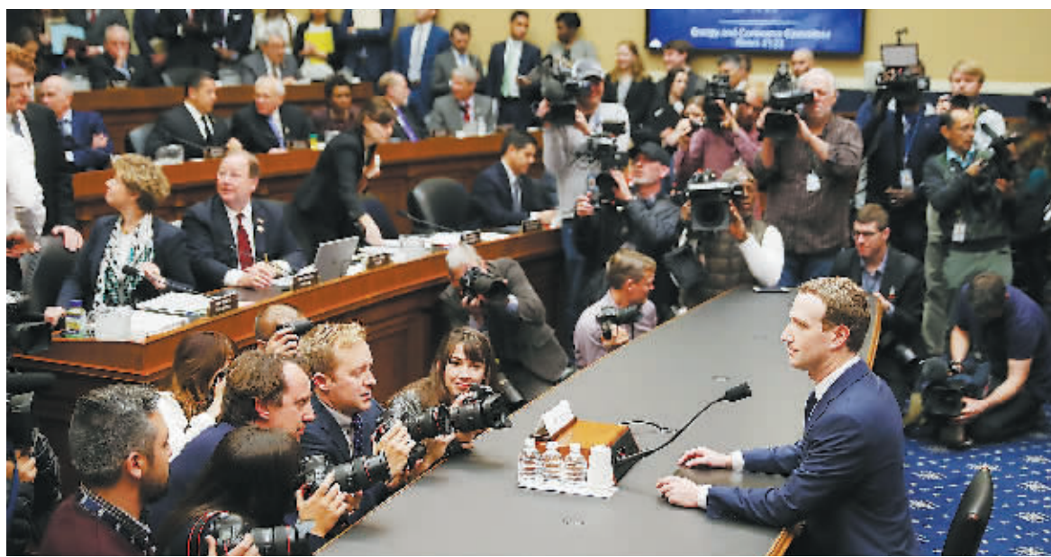
11日,美国社交媒体平台Facebook公司首席执行官马克·扎克伯格出席美国国会众议院能源和商业委员会听证会。

当地时间11日,美国社交网站Facebook(脸书)创始人马克·扎克伯格连续第二天来到国会,向众议院能源与商业委员会解释英国顾问公司剑桥分析盗用Facebook用户资料事件。扎克伯格向众议院议员表示,连自己的个人数据都曾被恶意的第三方取用。