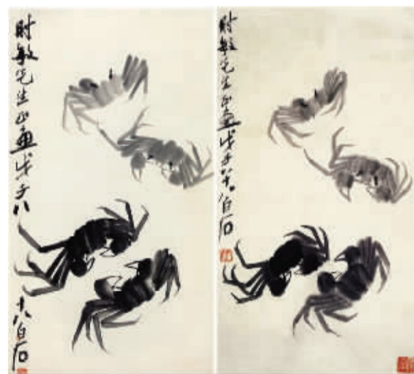
左:蟹(伪作) 右:齐白石《蟹》收录于《齐白石画集》

随着经济的不断发展,消费结构进入快速转型期,奢侈品已然不能满足高品质的生活方式,艺术品消费开始进入大众视野。以书画为代表的艺术品悄然成为新兴的投资渠道,在日益增长的社会需求与移动互联网过于宽泛的购买渠道下,艺术市场一片繁荣。然而,背后却隐藏着一直存在并危害极大的毒瘤——“名人书画”造假。比如,2017年底,贵州遵义警方成功破获一特大制假假冒名家书画作品案,总案值过亿元。