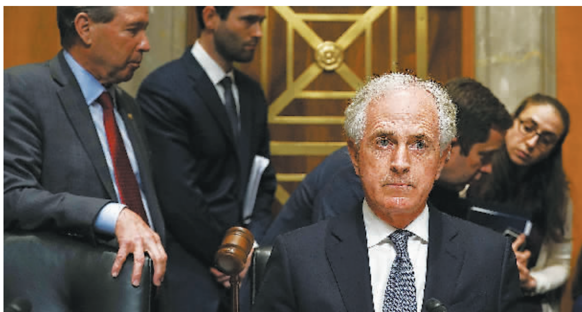
23日，美国华盛顿，参议院外交关系委员会对中共情报局长蓬佩奥提名国务卿进行投票。

当地时间23日，美国参议院外交关系委员会投票通过蓬佩奥的国务卿任命。蓬佩奥早年就读于美国西点军校和哈佛法学院，特朗普政府上任后，担任中央情报局局长一职。