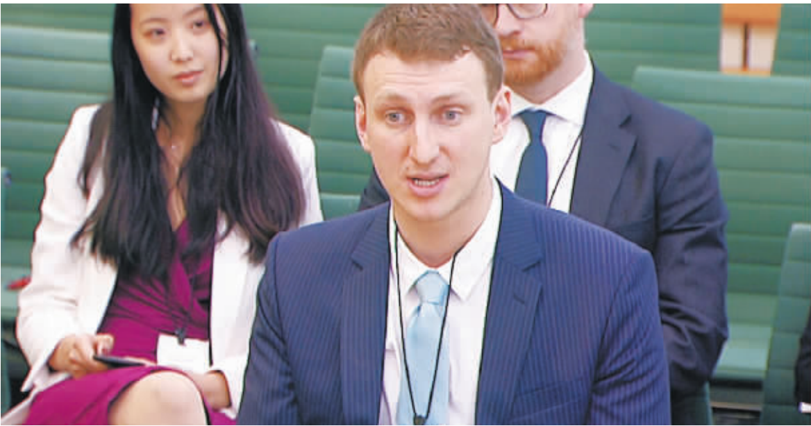
24日,英国伦敦,曾为Facebook公司工作的数据科学家亚历山大·科根在英国议会作证。

当地时间24日,英国伦敦,曾为Face-book(脸书)公司工作的数据科学家亚历山大·科根在英国议会作证。剑桥分析公司的英国分公司聘请科根收集Facebook用户的基本信息,以及用户们选择的“喜欢”的内容。