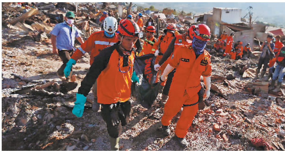
8日，在印度尼西亚中苏拉威西省帕卢，救援人员转移遇难者遗体。

印度尼西亚抗灾署8日通报，印尼中苏拉威西省日前发生的强烈地震及地震引发的海啸已经造成1948人死亡。印尼抗灾署发言人苏托波在当天举行的新闻发布会上说，截至8日13时，灾难还造成835人失踪、1.07万人受伤，其中2549人重伤。