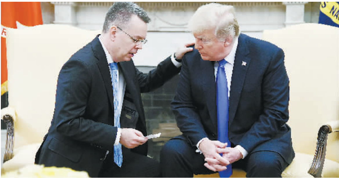
13日,被土耳其拘禁两年的美国牧师安德鲁·布伦森获释返美。总统特朗普在白宫椭圆形办公室与他见面。

被土耳其拘禁两年的美国牧师安德鲁·布伦森获释返美,当地时间13日下午,布伦森在白宫与美国总统特朗普会面。据报道,布伦森从土西部伊兹密尔市乘机前往德国的拉姆施泰因空军基地进行医疗检查,随后返回美国。