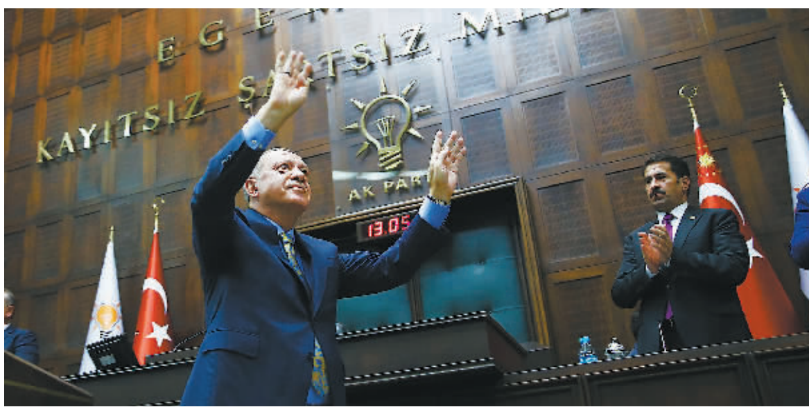
23日,土耳其总统埃尔多安在议会发表讲话。

23日,土耳其总统埃尔多安在其执政党正义发展党每周的例行集会上,针对沙特阿拉伯记者卡舒吉一案宣布土耳其方面的调查结果和介绍案件详情。