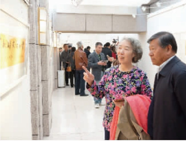
北京市政协原主席阳安江及其夫人参观书法展