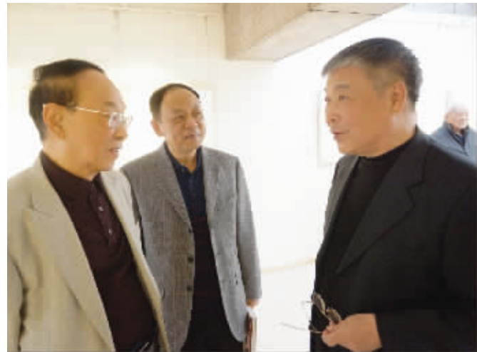
北京市政协原主席陈广文(左一)、商务部原副部长张志刚(右一)、中国文联原副主席夏潮在书法展上交谈