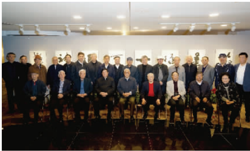
出席活动的领导及嘉宾合影留念