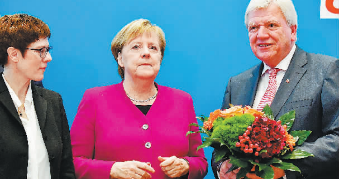
29日,德国柏林,德国总理默克尔在基民盟总部召开基民盟领导人会议。

据英国广播公司(BBC)29日报道,默克尔在当天的一个新闻发布会上称,她将于2021年卸任总理职务;“在任期结束后,我不会寻求任何政治职务”。29日稍早时,德国媒体报道,默克尔在党内一次高级官员参加的会议上表示,将不寻求再次参选执政党基督教民主联盟(CDU)党首职务。不过上述报道称,默克尔将继续担任联邦总理一职。