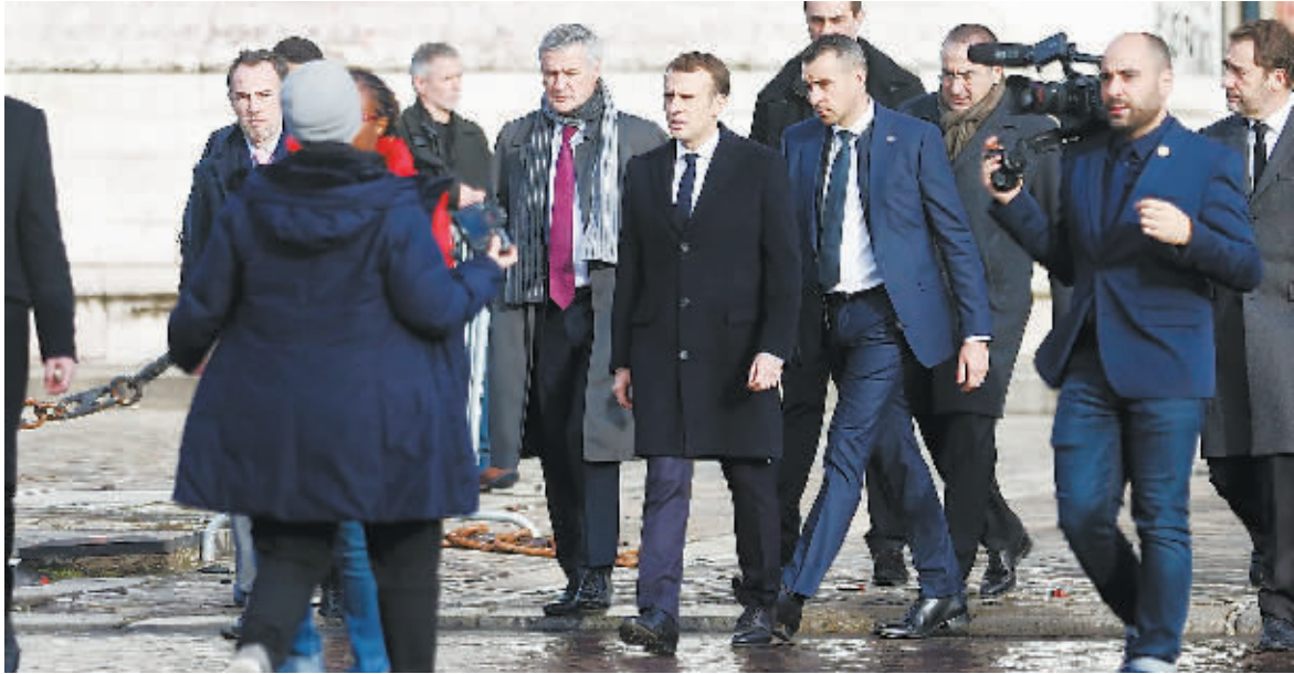
2日,法国总统马克龙走访前一日发生暴力冲突的街道。

当地时间12月2日,法国巴黎,法国总统马克龙走访前一日发生暴力冲突的街道。12月1日“黄背心”示威者在巴黎市中心与防暴警察发生激烈冲突,反政府抗议者点燃了数十辆汽车,并纵火焚烧了店面。数千人参加了反对高燃油税的“黄背心”抗议活动。