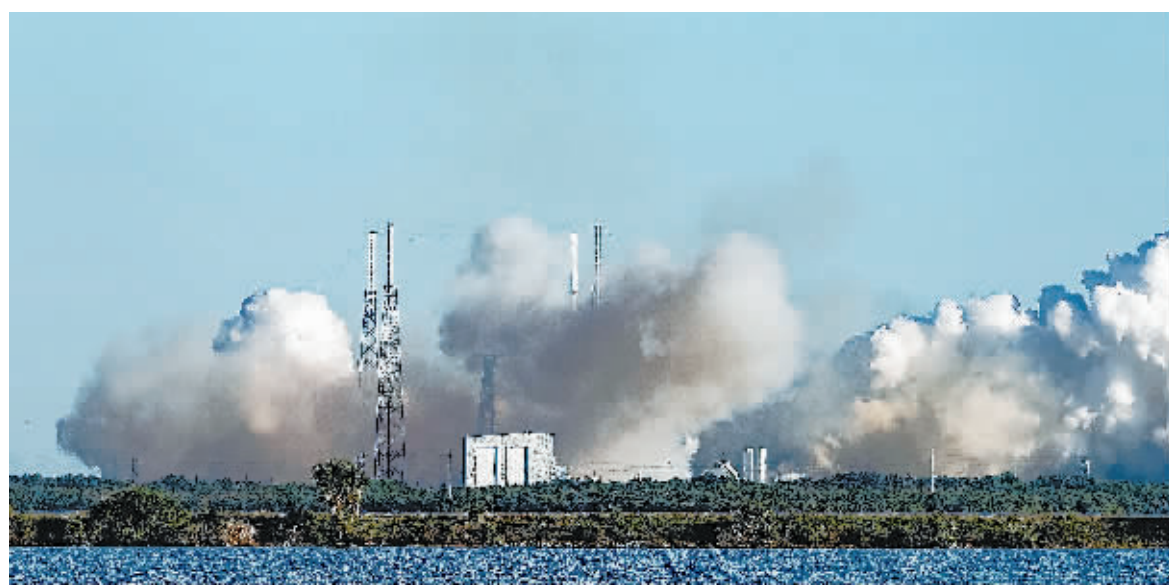
23日,SpaceX“猎鹰9号”火箭为美国空军发射GPS III系列军用导航卫星。

据外媒报道,当地时间上周日,SpaceX在佛罗里达州卡纳维拉尔角成功发射了美国空军的第一颗全球定位系统(GPS III)卫星,这是该航空公司迄今为止首次执行与美国国家安全相关的发射任务。GPS III卫星是美国空军有史以来最强的一颗GPS卫星,它将是更新全球定位系统的一系列新卫星中的一颗,它搭载SpaceX的“猎鹰9号”两级火箭进入太空。在发射2小时后,卫星与火箭分离,开始独立运行,这颗卫星被部署到中地球轨道。