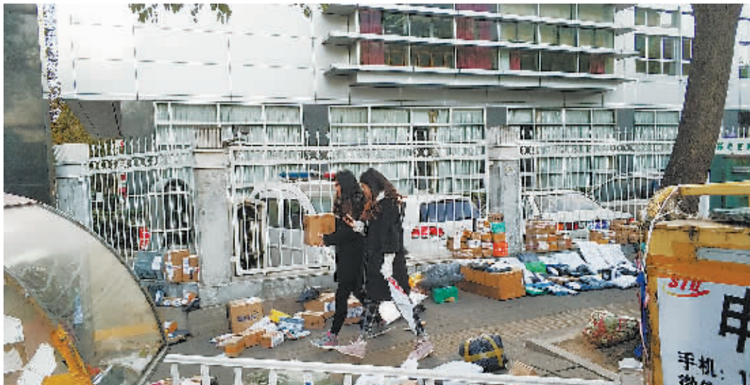
首都师范大学教学区附近的快递“集散地”

关于目前大学在校生的互联网信用消费,实际情况和人们的想象不尽相同,他们的消费习惯和支付习惯已经发生了新一轮的迭代。