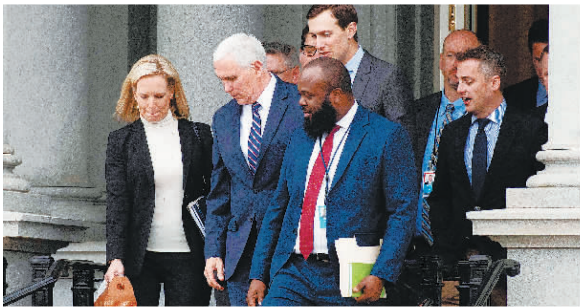
5日,美国副总统彭斯偕同白宫官员在白宫举行会议,寻求解决办法。

美国白宫和国会民主党5日各派代表就修建美国和墨西哥边境隔离墙拨款等问题举行磋商,但并未取得实质性突破。这意味着已超过两周的美国联邦政府“停摆”还将继续。据美国副总统彭斯办公室在会后发布的通报,双方未能就具体拨款数额进行深入对话,但同意6日下午继续会面。