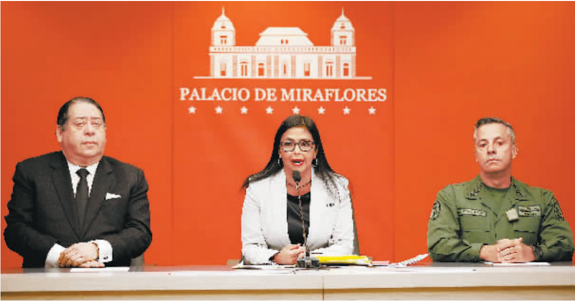
8日，委内瑞拉副总统罗德里格斯(中)在首都加拉加斯出席新闻发布会。

委内瑞拉副总统罗德里格斯8日在电视讲话中说，美国当天对委内瑞拉宣布新的制裁措施不合理也不合法，委内瑞拉不怕威胁。美国财政部8日宣布对7名委内瑞拉个人及23个实体实施制裁。受制裁的实体中，一些在委内瑞拉注册，多数在纽约、迈阿密等美国城市注册。