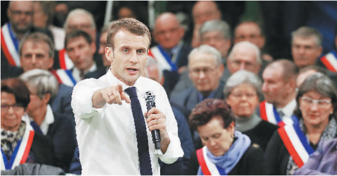
15日,在法国西北部厄尔省,法国总统马克龙在与数百名市长的集会中发言。

法国总统马克龙15日在法国西北部厄尔省正式启动将持续两个月的全国辩论,以凝聚法国社会对推进改革的共识。