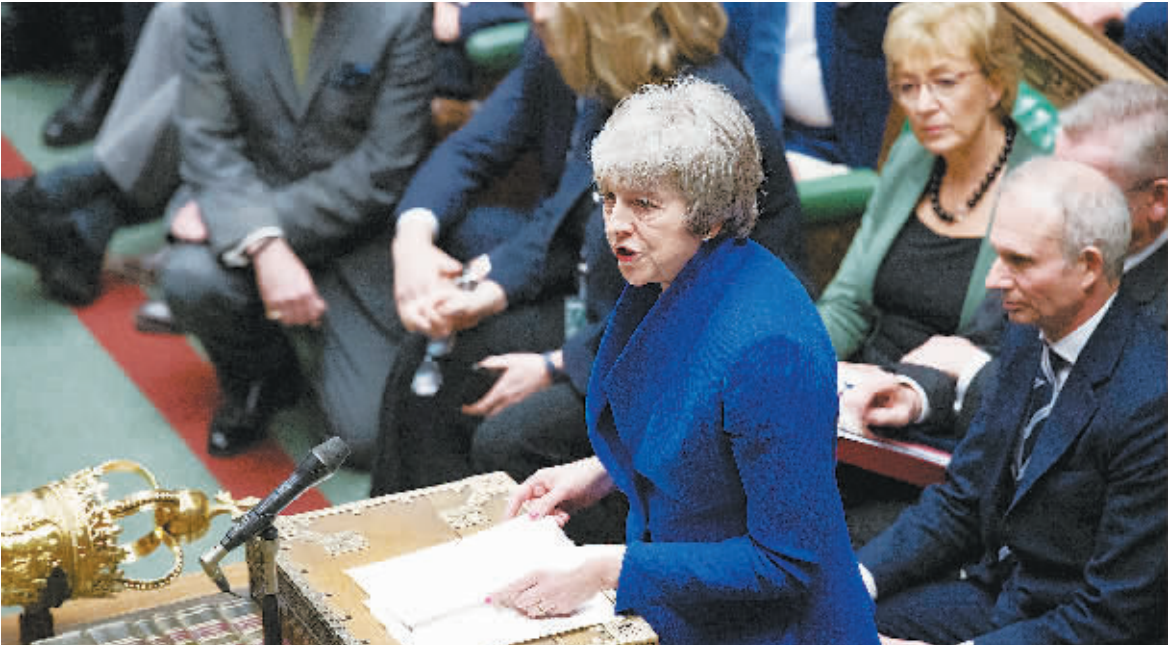
16日,英国首相特雷莎·梅在伦敦议会下院参加辩论。

英国议会下院16日经投票表决,否决了对英国政府的不信任动议。当天,英国议会下院在进行辩论后,以325票反对、306票赞成的投票结果否决了由反对党工党领导人科尔宾提出的对政府不信任动议。随后,英国首相特雷莎·梅表示,政府将在21日提交脱欧协议被否决后的替代计划(B计划)。