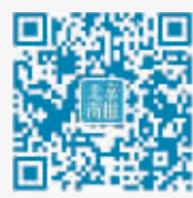
北京商报官方微信