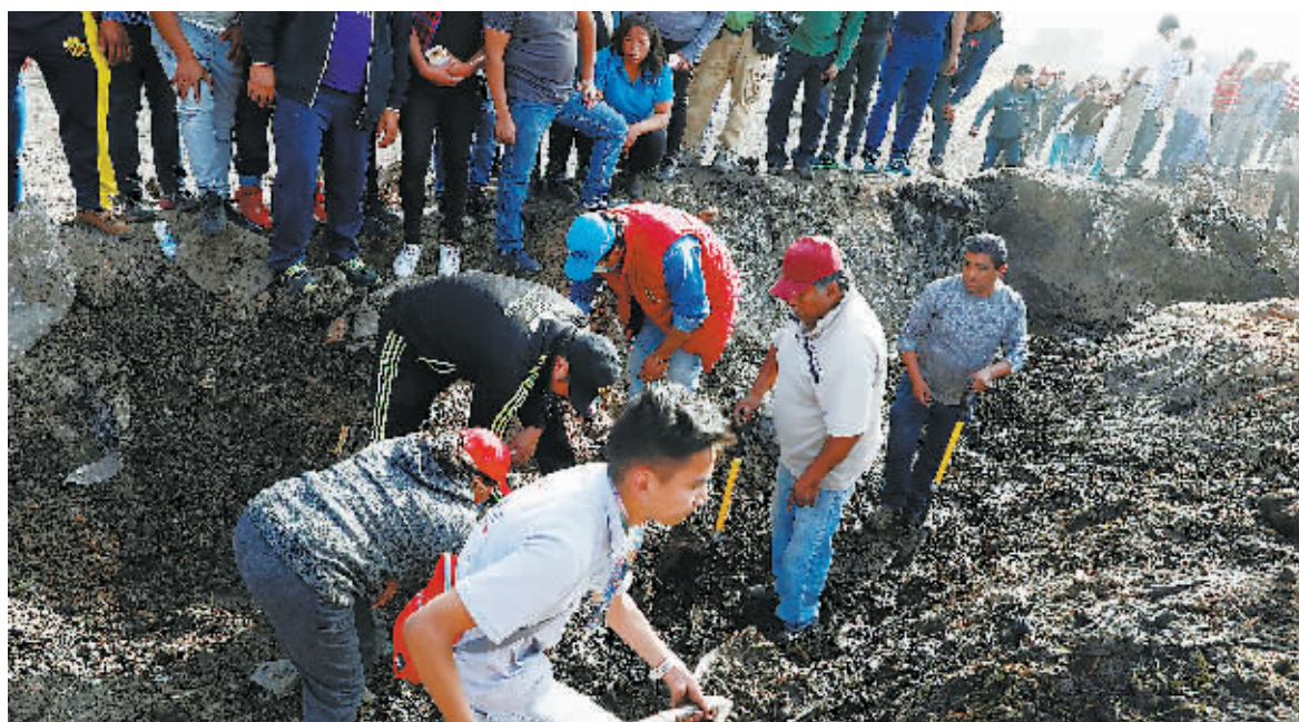
20日,居民们在管道爆炸现场寻找有助于辨认遇难亲友的遗骸和物品。

据CNN报道,截至当地时间20日,墨西哥输油管道爆炸死亡人数已升至85人,另有58人受伤。墨西哥伊达尔戈州特拉韦利尔潘市的一处输油设施18日下午遭不法分子偷油,随后发生爆炸并造成大量人员伤亡。据悉事发时现场聚集了600-800名民众。