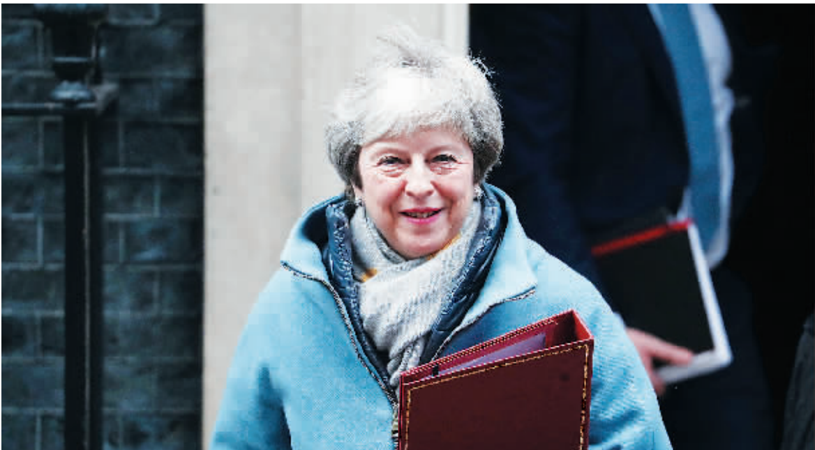
21日,英国首相特雷莎·梅离开唐宁街10号前往议会下院。

英国首相特雷莎·梅21日说,她正与英国一些党派就此前被议会否决的“脱欧”协议进行协商,并将继续与欧盟进行谈判。特雷莎·梅当天在英国议会下院说,她正与北爱尔兰民主统一党等党派就协议中有关“脱欧”后爱尔兰边界问题的内容进行协商。