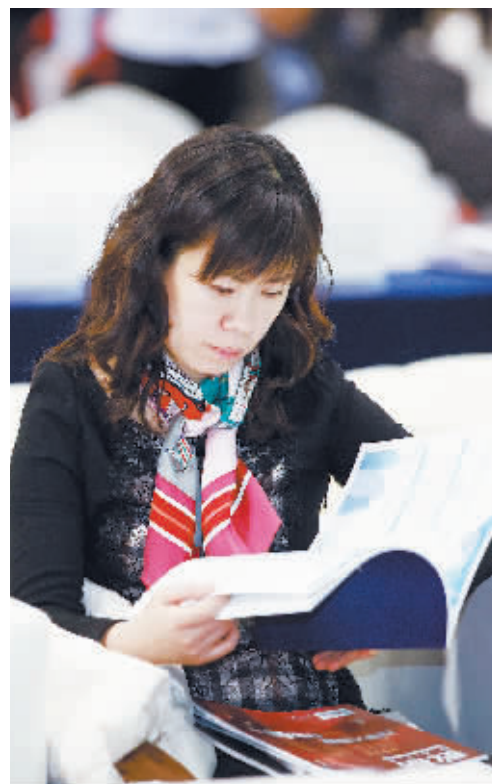
与会嘉宾认真阅读《2018北京商业发展蓝皮书》