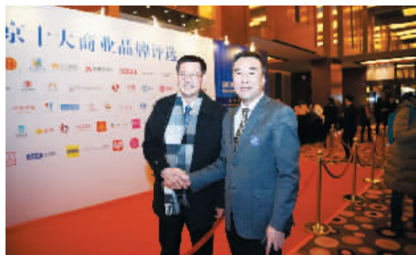
与会嘉宾热情交流