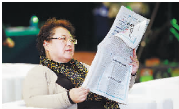
与会嘉宾翻看《北京商报》