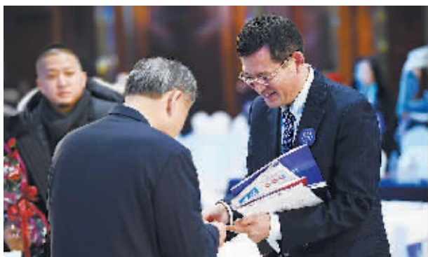
与会嘉宾交换名片