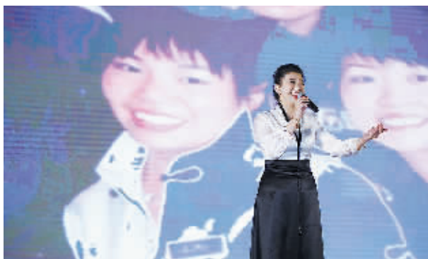
致敬改革开放四十年,青年歌手献唱《春天的故事》