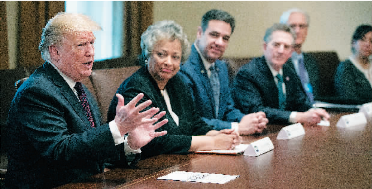
23日,美国总统唐纳德·特朗普在白宫与保守党领导人举行圆桌会议,讨论南部边境的安全和人道主义危机。

肆意蔓延的“黄背心”揭开了覆盖在欧洲身上的面具。“法国骚乱将打击欧盟”,此前俄罗斯《观点报》曾如此形容,报道认为,“黄背心”骚乱证明这不仅是法国的问题,而是整个欧洲的问题。欧洲各国民众对国家精英当前实施的政治路线不满,这是多年来积累的问题开始爆发。法国是精英路线失败的绝佳例子。法国智库公共政策研究所最新公布的研究显示,在马克龙的税务改革政策中获益最大的仍然是法国最富有的1%人群。而在巴黎肆无忌惮的“黄背心”大军高举的正是这样一则标语:我们想要一个穷人的总统,在这之前,马克龙被许多人指责为“富人总统”,被忽视的小城镇和农村的选民,正是他