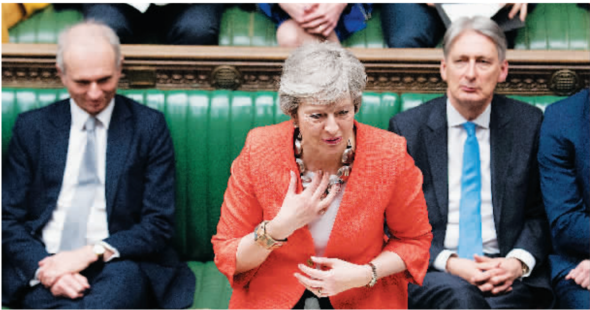
12日,英国首相特雷莎·梅出席议会下院辩论。

在13日英国议会下院即将就“是否无协议脱欧”进行投票的当天清晨,英国政府在关于无协议脱欧的临时安排中宣布,如果脱欧,英国将对总金额占87%的进口商品免征关税;目前英国对进口总额80%的商品免征关税。此外,英国对于从爱尔兰陆地边界进口到北爱的所有商品将免征关税,对英国北爱同爱尔兰的边境“单方面”免边检。