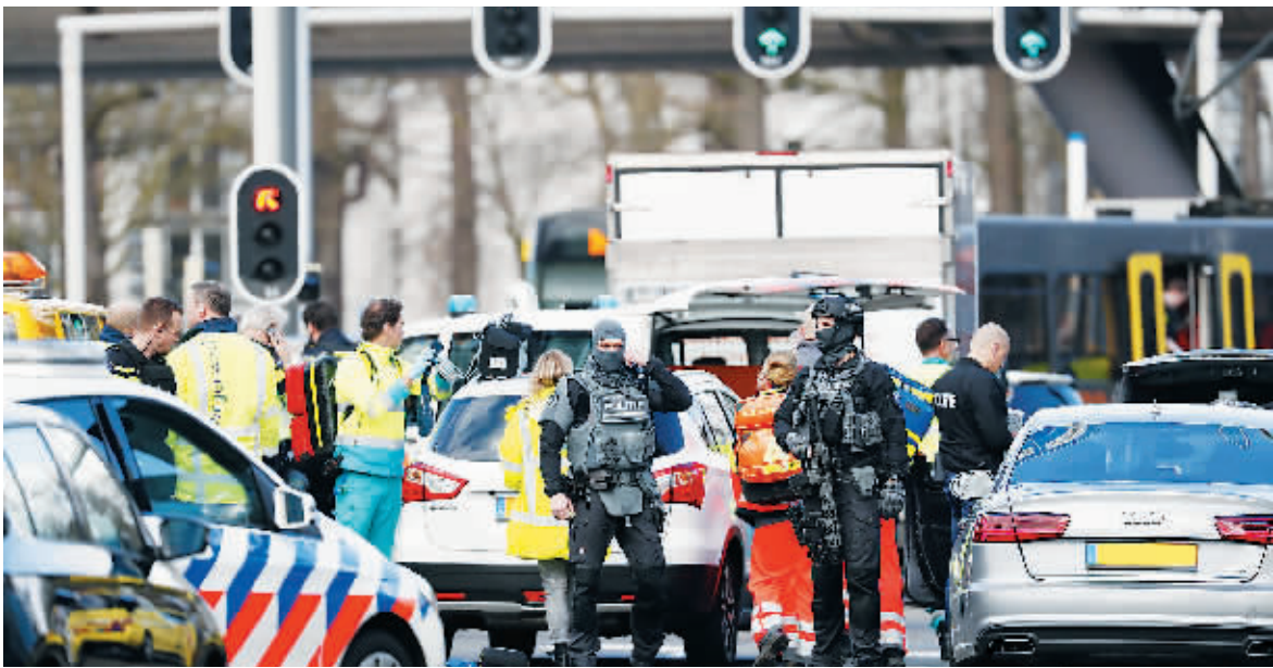
18日,荷兰乌得勒支发生枪击事件,已造成3人死亡、9人受伤。

据外媒报道,荷兰中部城市乌得勒支市18日发生电车枪击事件,目前已造成至少3人死亡、9人受伤。荷兰警方称,嫌疑人身份已经确定,是一名37岁的土耳其男子。警方在社交平台上一公布了该名嫌疑犯的照片,并呼吁当地市民提供嫌犯线索。