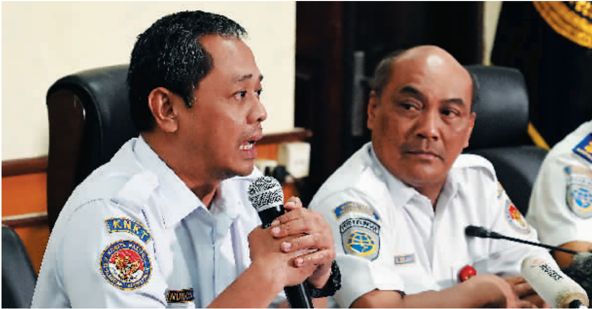
21日,印尼国家运输安全委员会负责人就狮航坠机事件再次召开发布会。

3月21日,多家媒体援引外媒报道称,去年10月29日印尼狮航JT610航班黑匣子录音内容显示,飞机坠毁前,飞行员还在翻操作手册。当地时间21日下午,印尼狮航调查小组召开新闻发布会称这些报道并非事实。