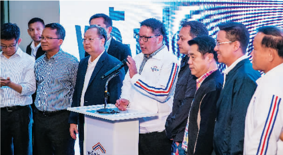
24日,人民国家力量党领导人乌达玛(右五)在大选投票结束后出席新闻发布会。

据泰国选举委员会24日晚的初步计票结果,支持现任总理巴育的人民国家力量党在当天举行的泰国国会下议院选举中得票暂时领先。