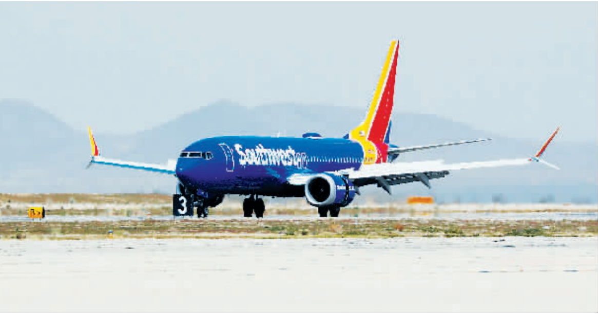
26日,美国加利福尼亚州维克多维尔,西南航空的波音737 MAX 8飞机。

最低工资的传统源于1938年,彼时美国第一次设定最低工资标准。此后,这一标准被陆续上调了20余次。目前,美国联邦政府规定的最低工资标准是每小时7.25美元,但与1968年约11美元的高点相比,仍相差甚远。