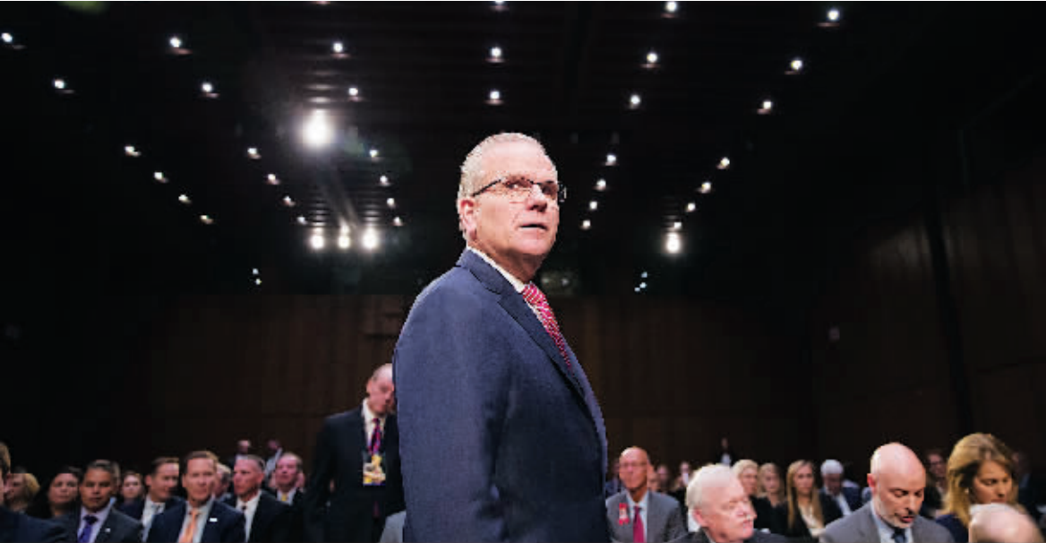
27日,美联邦航空局代理局长丹尼尔·埃尔韦尔出席听证会。

正对美联邦航空局进行调查的美国交通部27日表示,将对飞机安全的认证方式作出“重大改变”,但改变饱受争议的“认证外包”做法或难推行。美国参议院商务、科学和运输委员会当日举行听证会;“拷问”美联邦航空局允许波音公司对其产品进行安全认证一事。美国交通部督察长卡尔文·斯科韦尔在听证会上表示,7月前将对飞机安全的认证方式进行重大改革,推出新的监管流程,但未表明是否会取消“外包”。