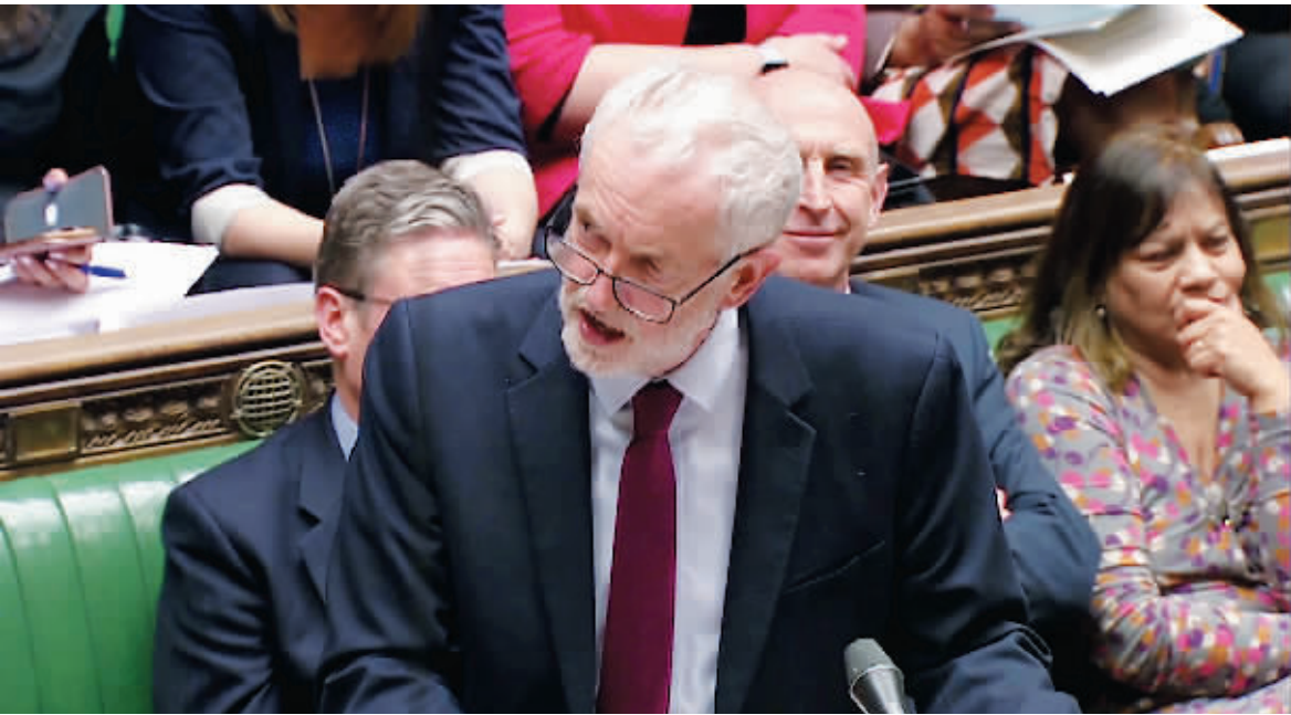
1日,英国反对党工党领导人科尔宾在议会发言。

据BBC报道,当地时间周一晚,英国议会下院第二次进行“指示性投票”,四个“脱欧”方案皆未获多数支持。欧盟负责“脱欧”事务的首席谈判代表巴尼耶称:“英国无协议脱欧的可能性越来越大了”。周一晚参与投票的方案包括,学习“挪威模式”留在欧盟统一市场内、任何“脱欧”协议都需举行第二次公投、与欧盟达成关税同盟等。