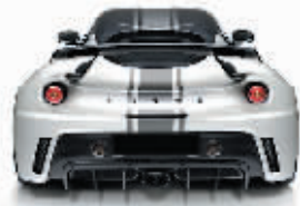
路特斯(莲花)品牌发展历程